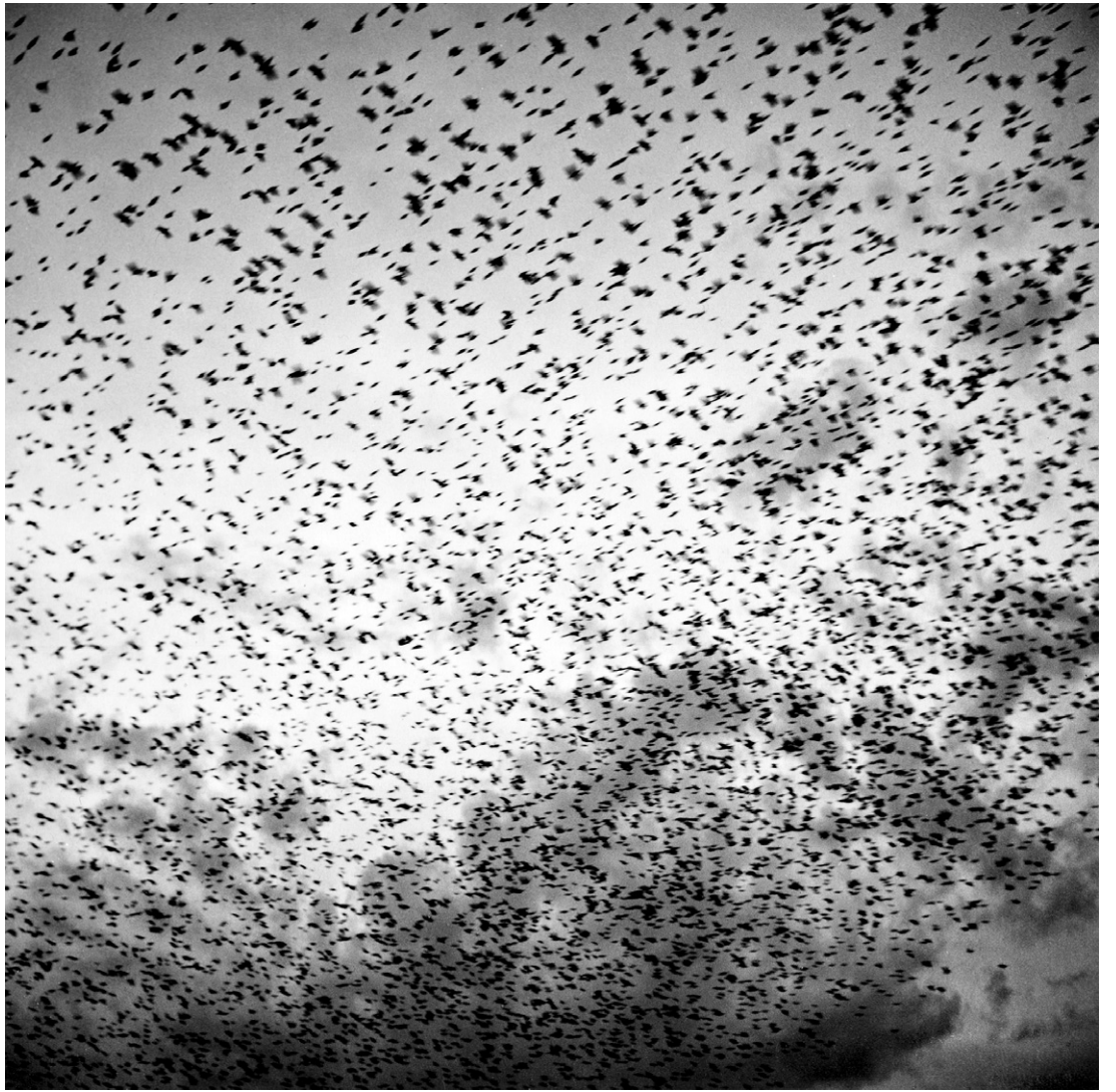
GRACIELA ITURBIDE, MÉXICO