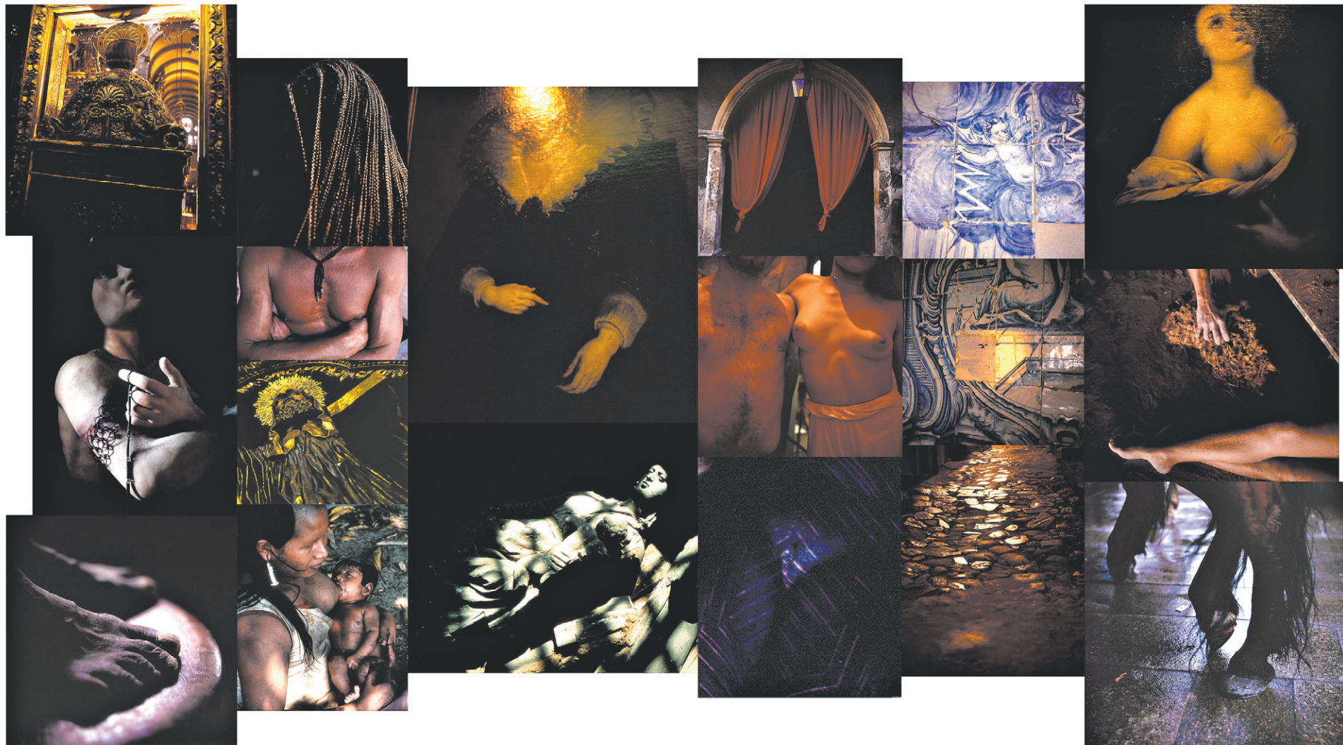
MIGUEL RIO BRANCO, BRASIL